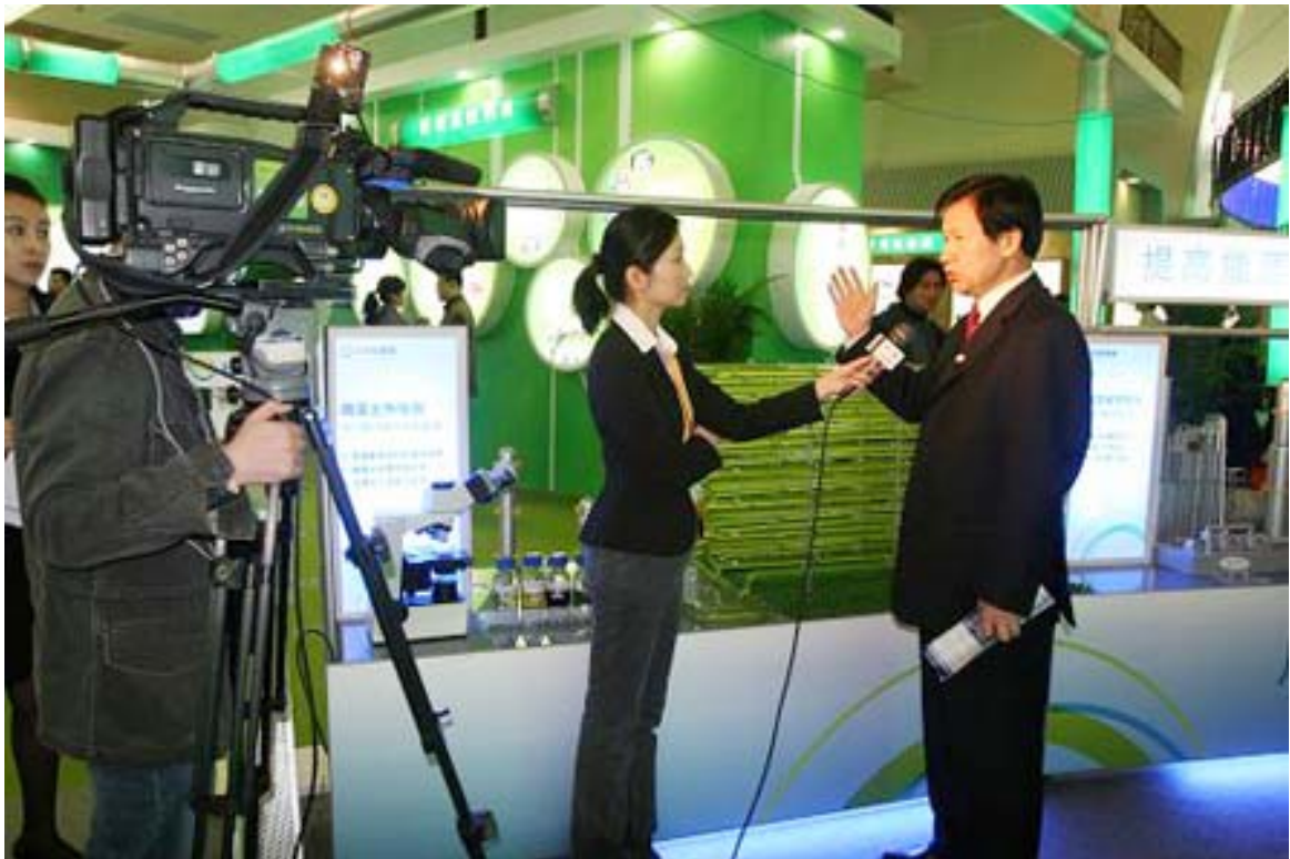
甘中学博士接受新闻媒体采访