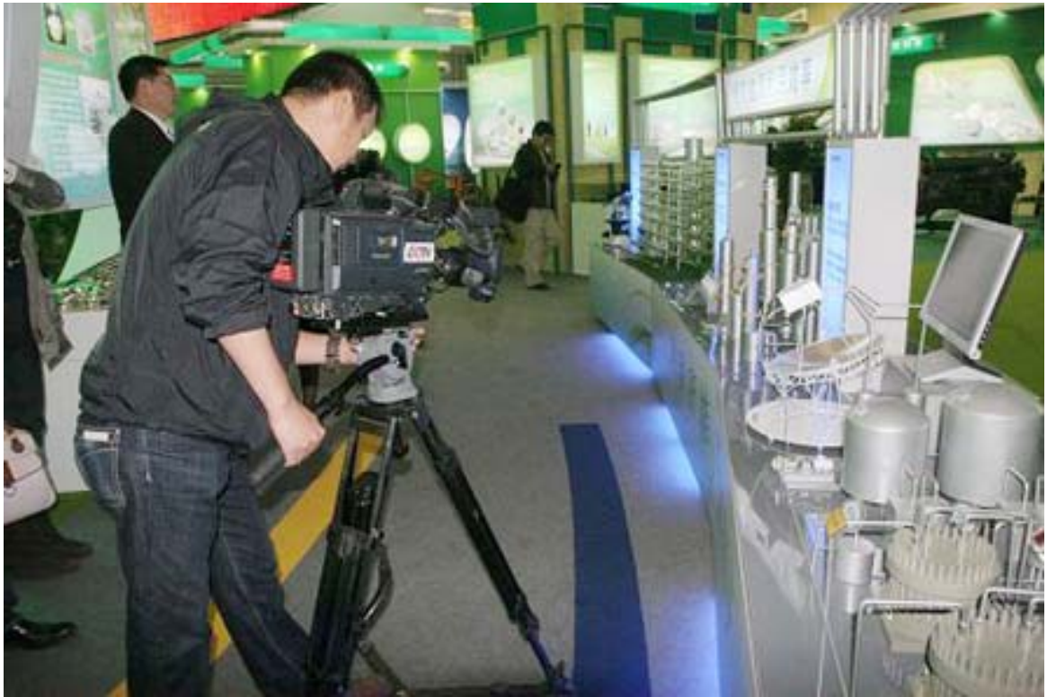
央视记者用镜头记录技术模型