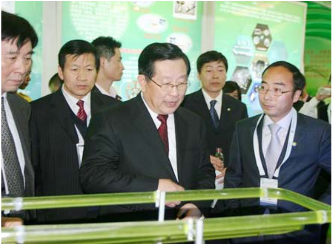
全国政协副主席、科技部部长万钢等领导参观展台